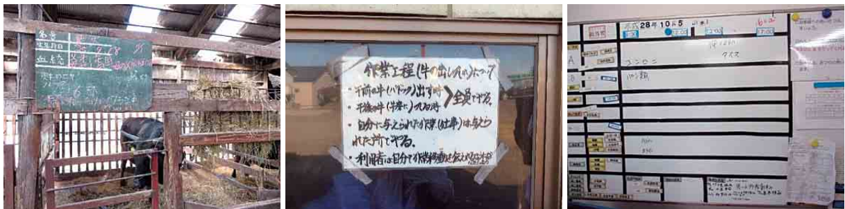
作業に取り組みやすくするためのさまざまな表示の工夫例 (家畜の名前と対応する飼料、注意事項など／作業の注意点／当日の作業目標や役割分担)

作業を覚えたら少しずつ技能が向上していきます。一人ひとりの得意不得意や仕事の許容量に合わせて、担当する作業を徐々に増やしていくこともよいでしょう。仲間どおしで競争したり、小さな目標を設定したりして、働くモチベーションを高めるようにしている現場もあります。例えば、担当作業の範囲が増えると、作業時に着用するヘルメットの色が変わるようにして、ヘルメットの色が一つのステータスとなるようにして作業者のモチベーションを高めているところもあります。