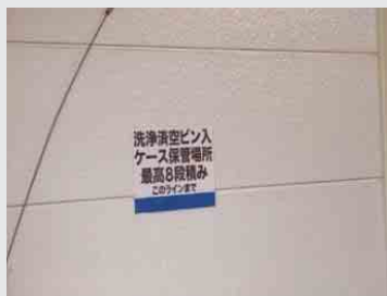
ガラスビンの保管場所を壁に表示 青い線で積み上げ高さの注意表示