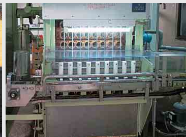
安全に使えるよう通常よりも作動速度を遅く改良した洗ビン機