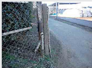
交通量の多い道路を挟んで牧場や飼料畑があります。作業者の飛出し防止のため、道路を挟んで光センサーを設置しています。

また、危険な範囲に囲いなどを設置して立ち入れないようにしたり、作業機械を改良したりします。